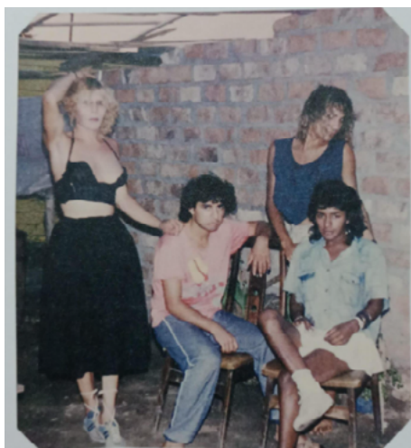
Figura 7. Casa Propia.