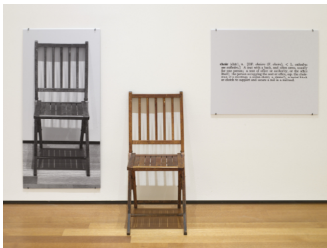
Figura 6. One and Three Chairs (1965).

La interrelación entre las imágenes, específicamente las fotografías, y el mundo de la palabra ha sido un tema recurrente desde la modernidad, tanto en el arte como en el periodismo. Por un lado, desde el auge del conceptualismo en los años 60, se ha desarrollado una tipología artística basada en el lenguaje y la representación. En este contexto, la incorporación de textos escritos alrededor o dentro de las obras fotográficas se ha consolidado como una de las posibilidades expresivas del género. Un ejemplo emblemático de esta convergencia es la instalación One and Three Chairs [Figura 6] de Joseph Kosuth, presentada en 1965. La obra incluye tres elementos: una silla plegable de madera en el suelo, una fotografía en blanco y negro de la misma silla colocada en la pared a la izquierda, y un panel de texto a la derecha que reproduce la definición de la palabra “chair” del diccionario. Estos tres elementos invitan a reflexionar sobre la relación entre los objetos y su representación, y sobre el estatuto de verdad tanto de la palabra como de la fotografía, y por extensión, del arte en general.