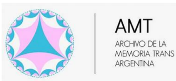
Figura 2. Logo del Archivo de la Memoria Trans

Así es como los archivos tienen lugar: en esta domiciliación, en esta asignación de residencia. La residencia, el lugar donde residen de modo permanente, marca el paso institucional de lo privado a lo público, lo que no siempre quiere decir de lo secreto a lo no-secreto. (Derrida, 1997, pp. 3-4)