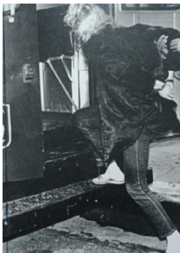
Fotografía 4. Crónica policial.