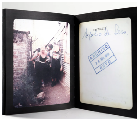
Figura 5. El velorio más largo del mundo.