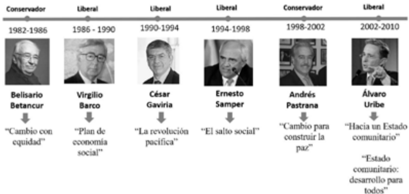
Gráfico 1: Línea de tiempo 1982-2010 PND y presidentes

Fuente: Elaboración propia con información de los Planes Nacionales de Desarrollo