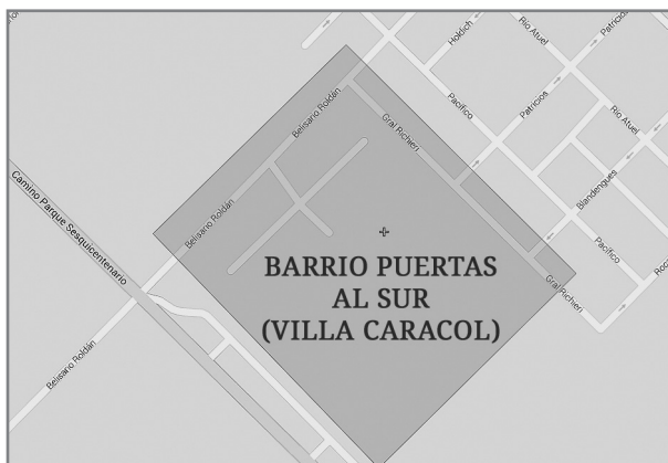
GRÁFICO 2 (AMPLIACIÓN DE LA ZONA)

Ampliación de la zona donde se encuentra el barrio