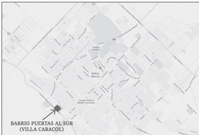
GRÁFICO 1 (MAPA DE CARACOL)

Plano de Bahía Blanca- 2013 (Fuente Google Maps)